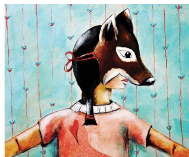
PARFOIS JE SUIS UN RENARD